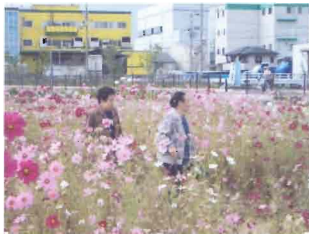
♪お天気の日には島のコスモス畑に行きました♪

年間行事の活動として、8月：歯の衛生講座、9月：敬老会、10月：日帰り交流会などをしました。