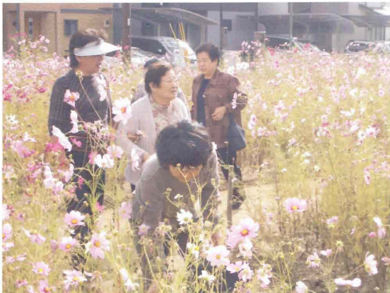
写真: 街かどステーション「ほっとスル」 島のコスモス畑にて・・・

発行: 特定非営利活動法人はっちぽっち 大阪府茨木市沢良宜浜3-12-19 茨木市立沢良宜いのち・愛・ゆめセンター内 TEL・FAX 072-637-5967 E-mailアドレス hotchpotch@hcn.zaq.ne.jp ホームページ http://www.hcn.zaq.ne.jp/cafjc101/